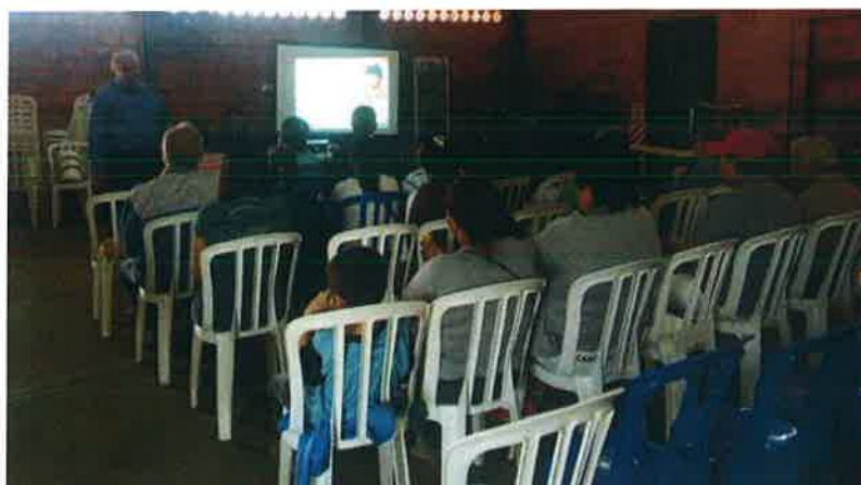
Las fotografías corresponden a la capacitación realizada en Mayo/2018 sobre "Salud e Higiene" en la zona de obras de la PTAR.