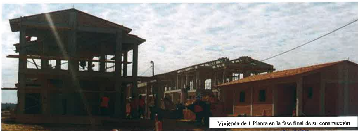
Vivienda de 1 Planta en la fase final de su construcción

Comentó además que se sumaron 6 cuadrillas de obreros para asegurar que el avance de las obras se realice de conformidad a los plazos previstos.